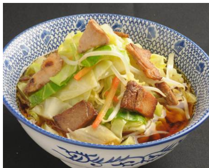
※野菜たっぷり とんさいらーめん